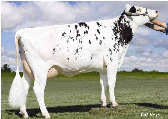
BKB SHOTTLE ARIN FIFTH DAM